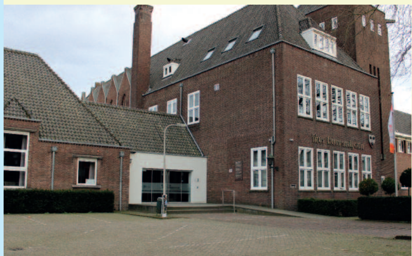
Foto: Titus Brandsma Lyceum in Oss.

De Bijbelse profeet Habakuk reikt ons de volgende woorden aan: "Wie in zijn hart niet deugt kwijnt weg; maar de rechtvaardige zal leven door zijn geloof." Dit Bijbelcitaat past goed bij Titus Brandsma, die rechte wegen ging in een kromme wereld. Hij werd geboren als Anno Sjoerd Brandsma, een naam die vertelt over zijn Friese afkomst. Als jonge man treedt hij in bij de Karmelieten, waar hij de kloosternaam "Titus" kiest. Hij blijkt een intelligente man te zijn en studeert in Nederland en Rome, waarna hij terugkeert in Nederland. Hij wordt hoogleraar aan de Universiteit van Nijmegen, waar hij in 1932 rector-magnificus wordt. Titus verdiept zich onder andere in de Middeleeuwse beweging van de Moderne Devotie, waar vroomheid, kennis en maatschappelijke verantwoording elkaar versterkten. Dat Titus geen boekenwurm was, maar oog had voor de ontwikkelingen in zijn omgeving, blijkt uit de wijze waarop hij wijst op het gevaar van het nationaalsocialisme.